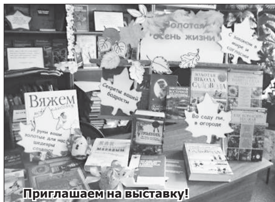
Приглашаем на выставку!

Мастерить шкатулки из зубочисток, картона и ниток оказалось не так-то просто, но очень интересно и увлекательно. Занятия всем понравились, домой с пустыми руками не ушел никто, у каждого участника мастер-класса на память осталась поделка.