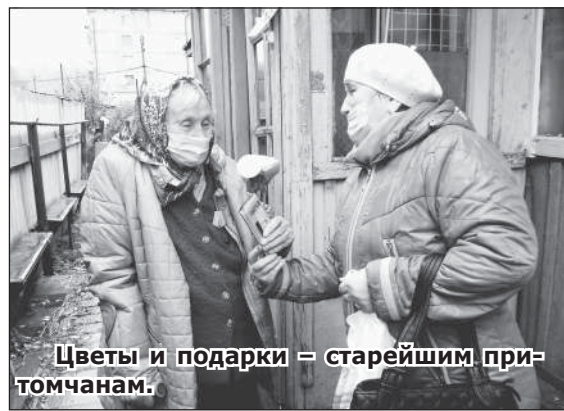
Цветы и подарки — старейшим притомчанам.

Поздравила всех ветеранов и первоклассни-