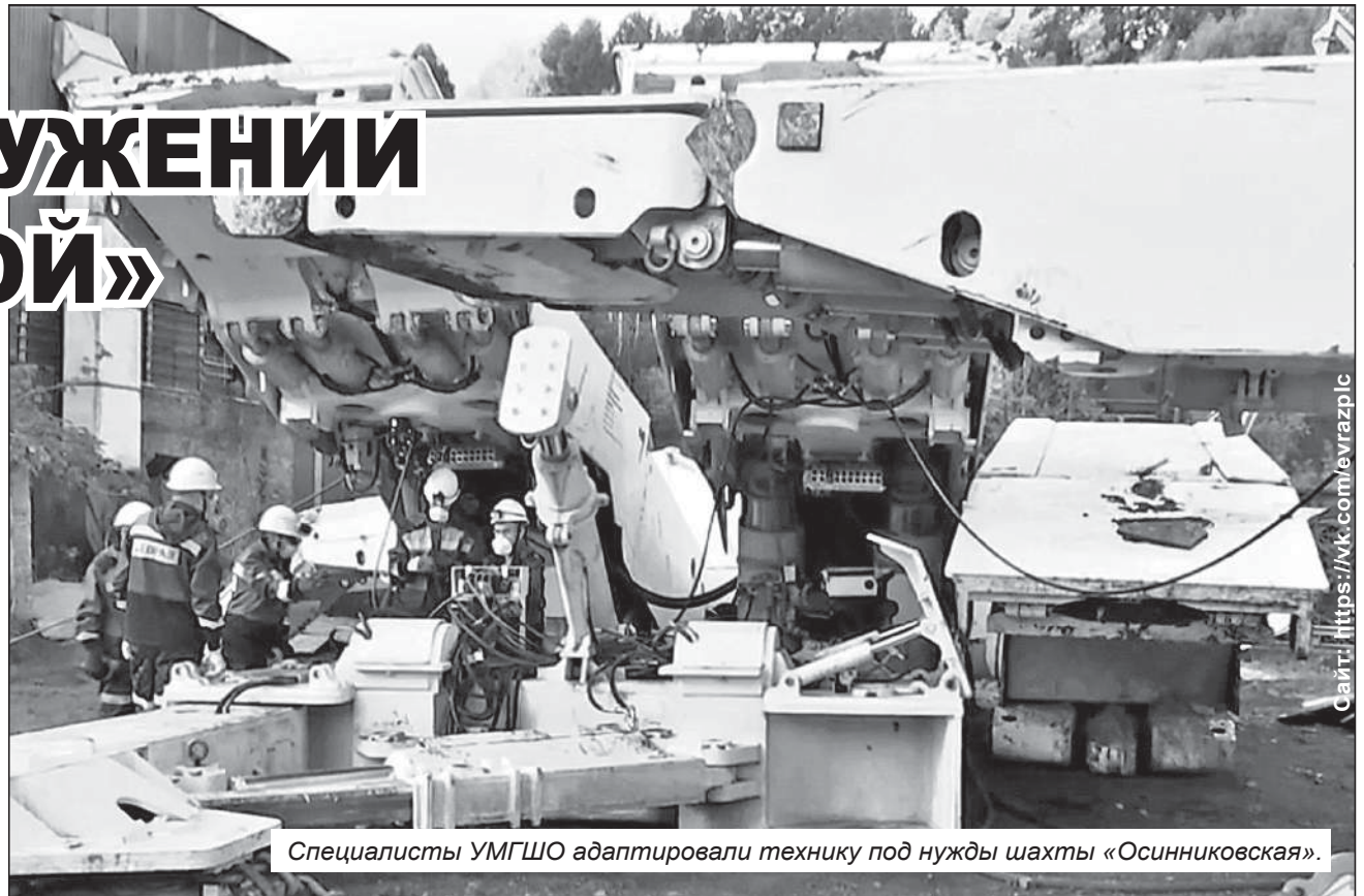
Специалисты УМГШО адаптировали технику под нужды шахты «Осинниковская».

Современный демонтажный мехкомплекс разработан с учетом особенностей горных выработок шахты «Осинниковская» и совсем скоро появится у горняков угольного предприятия. Они работают в сложных условиях – на крутонаклонных, до 15 градусов, пластах. Оборудование управляется дистанционно, что обеспечивает безопасность и позволяет двигать секции без канатно-тяговых систем (лебедок). Это новый шаг в техническом перевооружении производства! Сейчас комплекс проходит тестовые испытания, и до конца сентября будет спущен в шахту для демонтажа лавы 4156. В случае успешных испытаний оборудование поставят на шахту «Алардинская» и другие предприятия Распадской угольной компании.